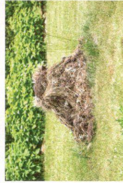
Kompostiranje na hrpi